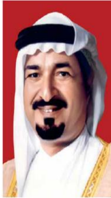
صاحب السمو الشيخ